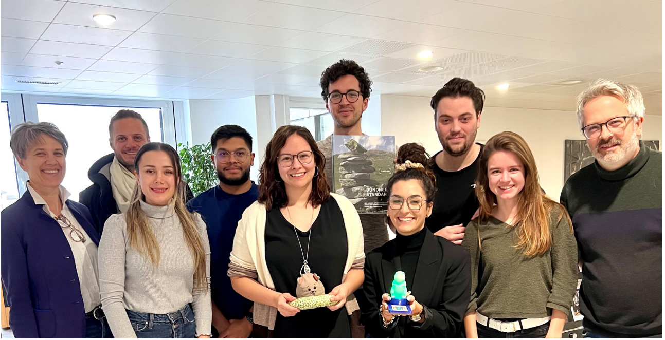
Studenten der FH Graubünden – Design Thinking Projekt im Frühjahr 2023