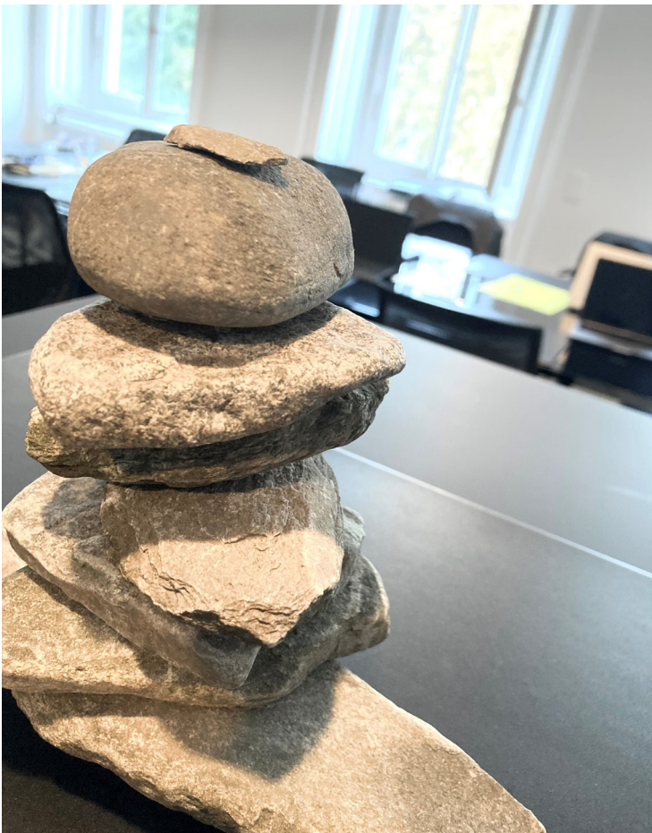
«Steimandli» als Symbol bei der Stiftungsgründung am 6. September 2022