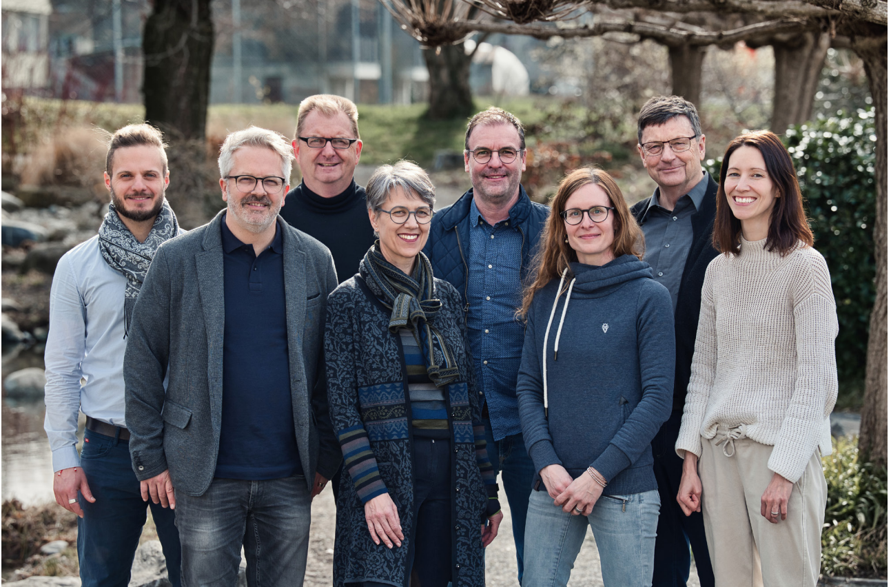
Stiftungsrat März 2024